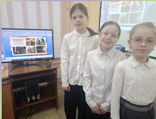
Разговоры о важном в 4 Г классе.