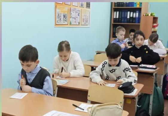
Разговоры о важном в 3 Б классе.